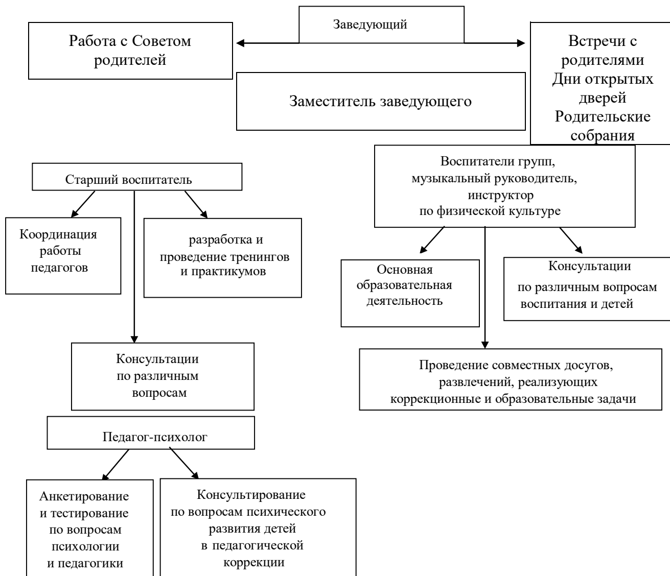
Схема взаимодействия с семьями воспитанников

Исследование социального статуса семей воспитанников. Исследование социального статуса семей воспитанников проводится ежегодно, в сентябре и является фундаментом для совершенствования планирования работы с родителями, направленной на личностно ориентированный подход к семьям.